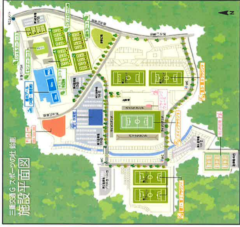
三重交通G スポーツの杜 鈴鹿 施設平面図

主催：三重交通G スポーツの杜 鈴鹿 ※各施設のイベントについては内容が変更する場合があります。